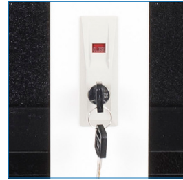
Cerradura: Llave escritorio