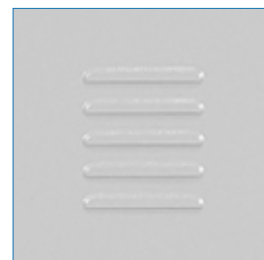
Celosía disponible en cada puerta