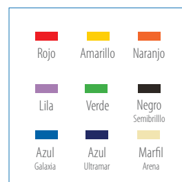
Colores de puertas disponibles

* Pintura de puertas con costo adicional.