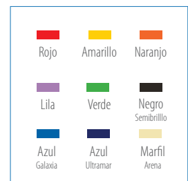
Colores de puertas disponibles