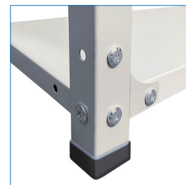
Pies con cubierta protectora