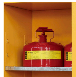
Bandejas regulables con soportes soldados