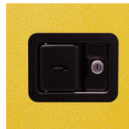
Cerradura de seguridad de 3 puntos