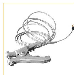
Cable Antiestática incluido