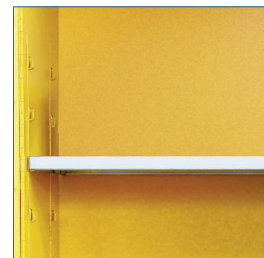
Bandejas regulables con soportes soldados