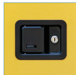
Cerradura de seguridad de 3 puntos

* Artículos de fotografía sólo para efectos demostrativos. No incluidos con el producto.