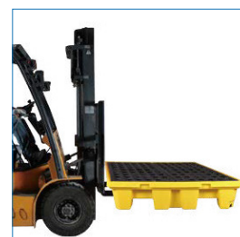
Compatible con grúas horquillas