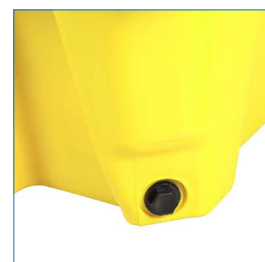
Incluye tapón de drenaje hexagonal para facilitar el drenaje