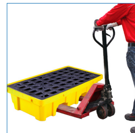
Compatible con carros transpaletas