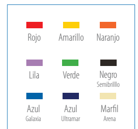
Colores de puertas disponibles