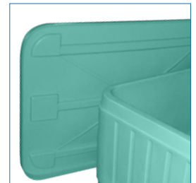
Tapa: Bipared apilable