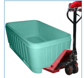
4 entradas, para grúa horquilla y transpaleta