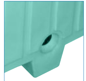
Desagüe opcional de 2"