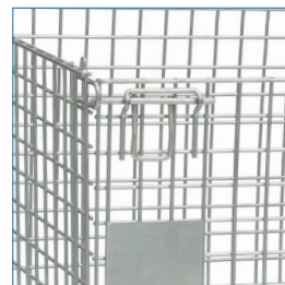
Estructura metálica, terminación Zinc