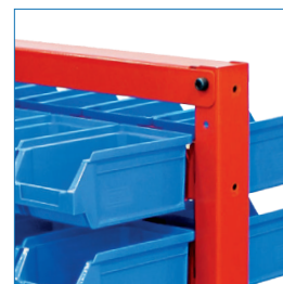
Estantería acero galvanizado