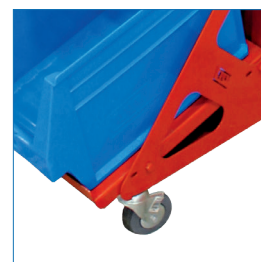
Ruedas con seguro de fijación.