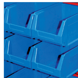
Gavetas polipropileno (PP)