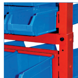
Estantería acero galvanizado