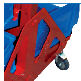
Ruedas con seguro de fijación.