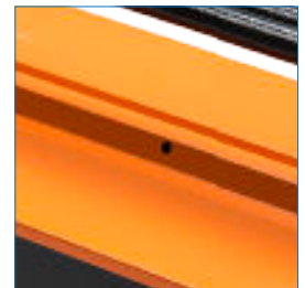
Orificio para candado