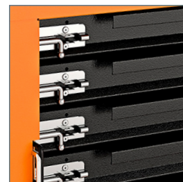
Rieles telescópicos para mayor apertura de los 5 cajones - Seguro metálico