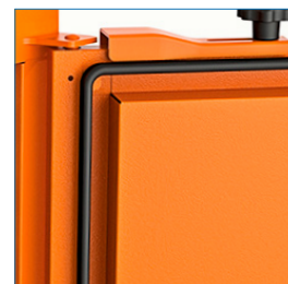
Puerta frontal con goma de obturación contra el polvo y agua.