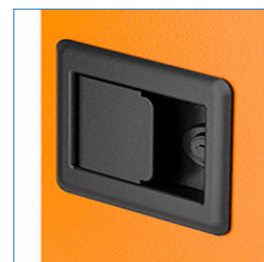
Cerradura reforzada con llave