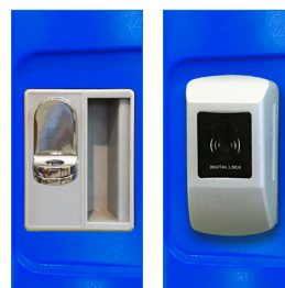
Porta Candado - Radiofrecuencia