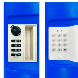
Clave manual - Clave electrónica