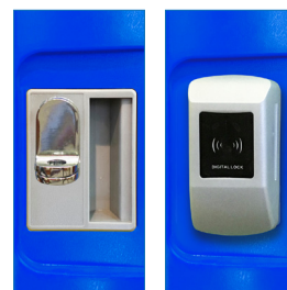
Porta Candado - Radiofrecuencia