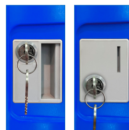
Llave escritorio - Moneda