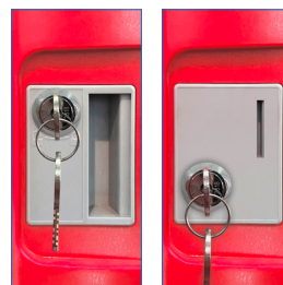
Llave escritorio - Moneda