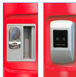
Porta Candado - Radiofrecuencia