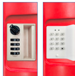
Clave manual - Clave electrónica