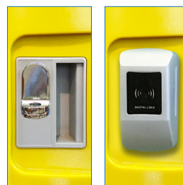
Porta Candado - Radiofrecuencia