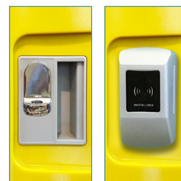
Porta Candado - Radiofrecuencia