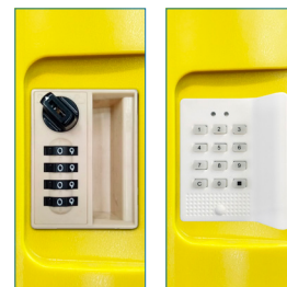
Clave manual - Clave electrónica