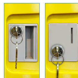
Llave escritorio - Moneda