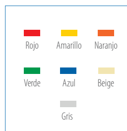
Colores de puertas disponibles