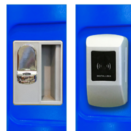
Porta Candado - Radiofrecuencia