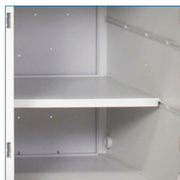
Bandejas interiores removibles