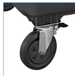
4 Ruedas con seguro de fijación, eje giratorio.