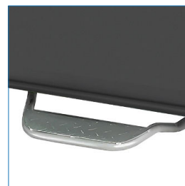
OPCIONAL: Pedal frontal de apertura.