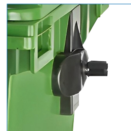
Barra para sistema de elevación, Manillas laterales.