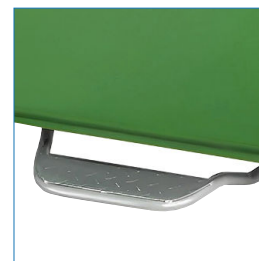
OPCIONAL: Pedal frontal de apertura.