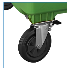
4 Ruedas con seguro de fijación, eje giratorio.