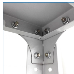
Escuadra de refuerzo en vértices