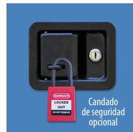
Cerradura de seguridad de 3 puntos