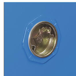
Respiradores para reducir concentración de sustancias volátiles