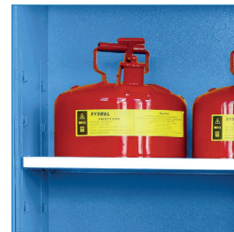
Bandejas regulables con soportes soldados