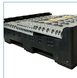
Pallet desarmado, Alto 36 cm.