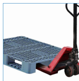
4 entradas grúa horquilla y 2 transpaleta