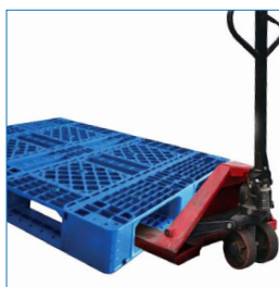
4 entradas grúa horquilla