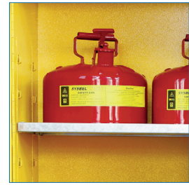
Bandejas regulables con soportes soldados