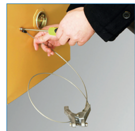
Cable Antiestática incluido