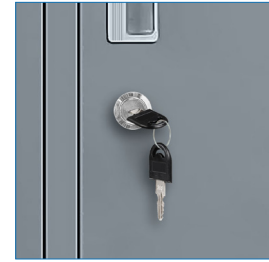
Cerradura llave escritorio