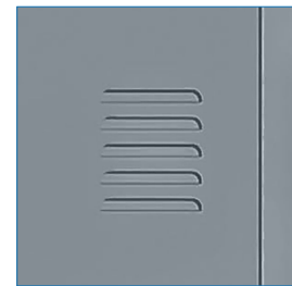
Celosía disponible en cada puerta

* Artículos de fotografía sólo para efectos demostrativos. No incluidos con el producto.