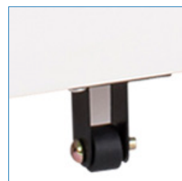
Rueda central anti vuelco