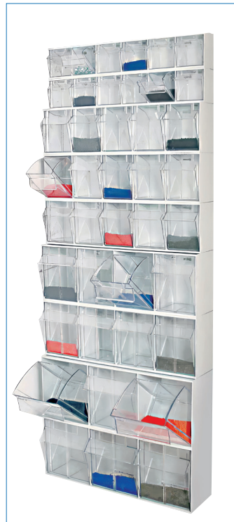
Ejemplo de configuraciones con soporte.

* Artículos de fotografía sólo para efectos demostrativos. No incluidos con el producto.