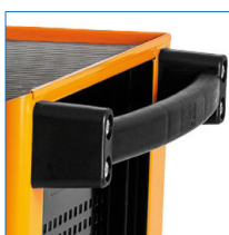
Tirador ergonómico y revestido de goma