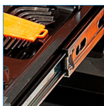
Traba para los cajones y puertas