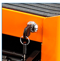
Cerradura - Llave escritorio