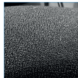
Asiento y respaldo acolchados