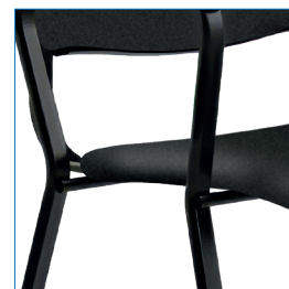
Vigas de soporte de asiento 19 mm.