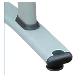
Pie de altura ajustable