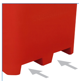
Entradas grúa horquilla o transpaleta