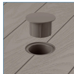
Perforación para fijar parasol (con tapa).