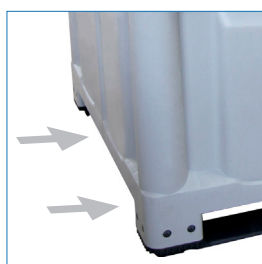
Entradas grúa horquilla y 2 transpaleta