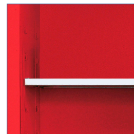
Bandejas regulables con soportes soldados