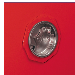
Respiradores para reducir concentración de sustancias volátiles