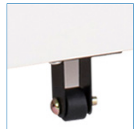
Rueda central anti vuelco