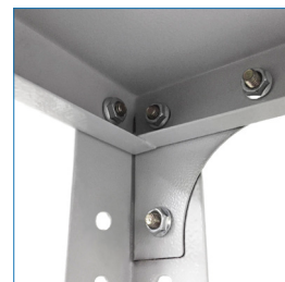
Escuadra de refuerzo en vértices