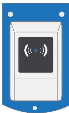
Cerradura de RF

Dispositivo instalado en la puerta de cada locker que acciona el pestillo por efecto de una señal de radiofrecuencia (RF).