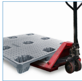
4 entradas: Grúa horquilla y transpaleta