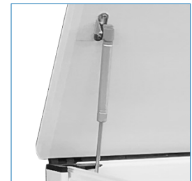
Cubierta con brazo pistón