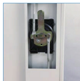
Triple bloqueo puertas