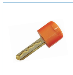
Llave de usuario con 16 millones de combinaciones