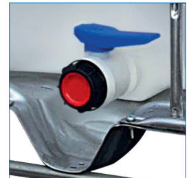
Válvula descarga de bola soldada de 2" de polietileno con hilo exterior.