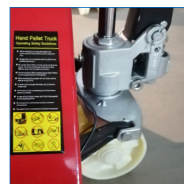
2 Ruedas direccionales con eje rotatorio.