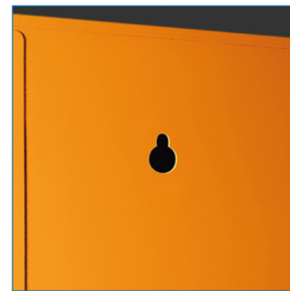
Agujeros para la fijación en pared con tornillos.