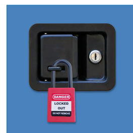
Cerradura de seguridad de 3 puntos